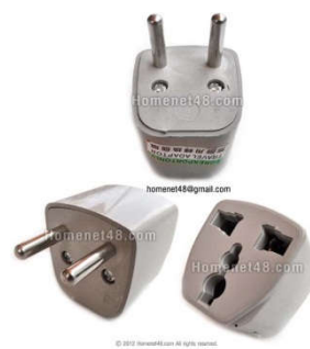
หัวแปลงจากแบนเป็นหัวกลม