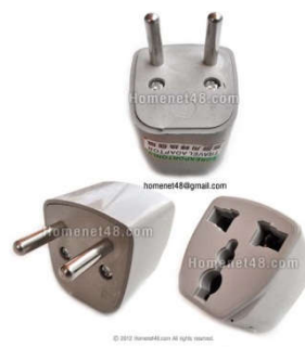
หัวแปลงจากแบนเป็นหัวกลม

เวลา: ช้ากว่าประเทศไทย 1 ชั่วโมง 15 นาที