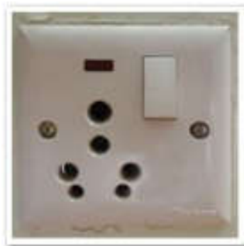
เต้าเสียบ

ปลั๊กไฟที่เนปาลเป็นแบบสามรูหัวแบนไฟ ๒๒๐ โวลท์เหมือนบ้านเรา หากสายชาร์จเป็นแบบหัวกลมต้องนำหัวแปลงสัญญาณเป็นหัวแบนติดไปด้วยครับ