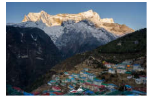
มื้ออาหาร